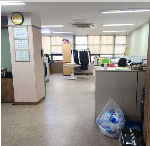
사무실 전반 사진