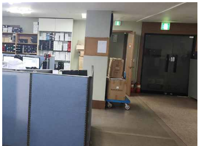
사무실 전반 사진